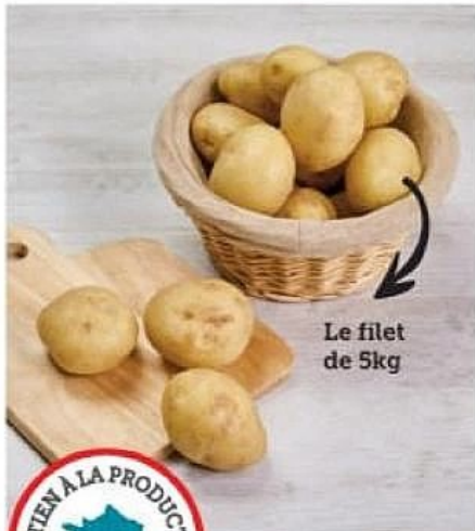
Le filet de 5kg