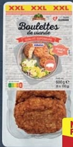
BOULETTES DE VIANDE (A) Fricadelles de porc. Réf. 5020253