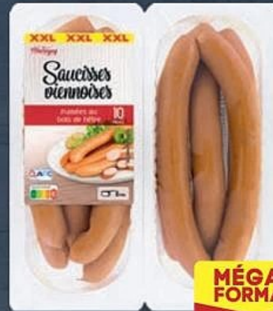
LE MARSIGNY ® SAUCISSES VIENNOISES (A) Réf. 5020252