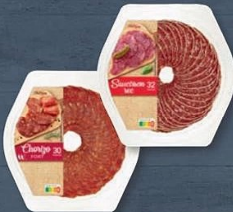
LE MARSIGNY ® ASSIETTE DE CHARCUTERIE (A) Au choix : chorizo fort ou saucisson sec. Réf. 6656