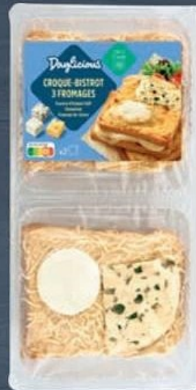
DAYLICIOUS ® 2 CROQUE-BISTROT 3 FROMAGES (B) Fourme d'Ambert AOP, emmental et fromage de chèvre. 2 x 150 g. Réf. 5020095